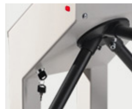
klíče pro mechanické odblokování